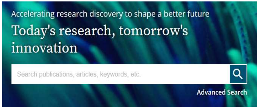
شکل ۳) جستجوی ساده

برای انجام جستجوی ساده کلیدواژه یا عنوان منبع موردنظر را در باکس جستجو وارد نموده، گزینه‌ی جستجو را کلیک نمایید.